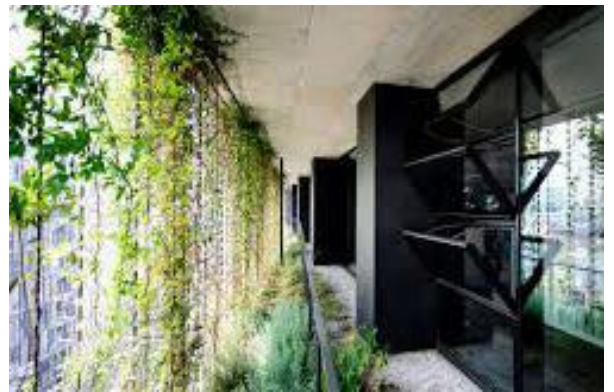
上:バルコニーのグリーンブラインド 下:逆スラブで生まれた床下空間