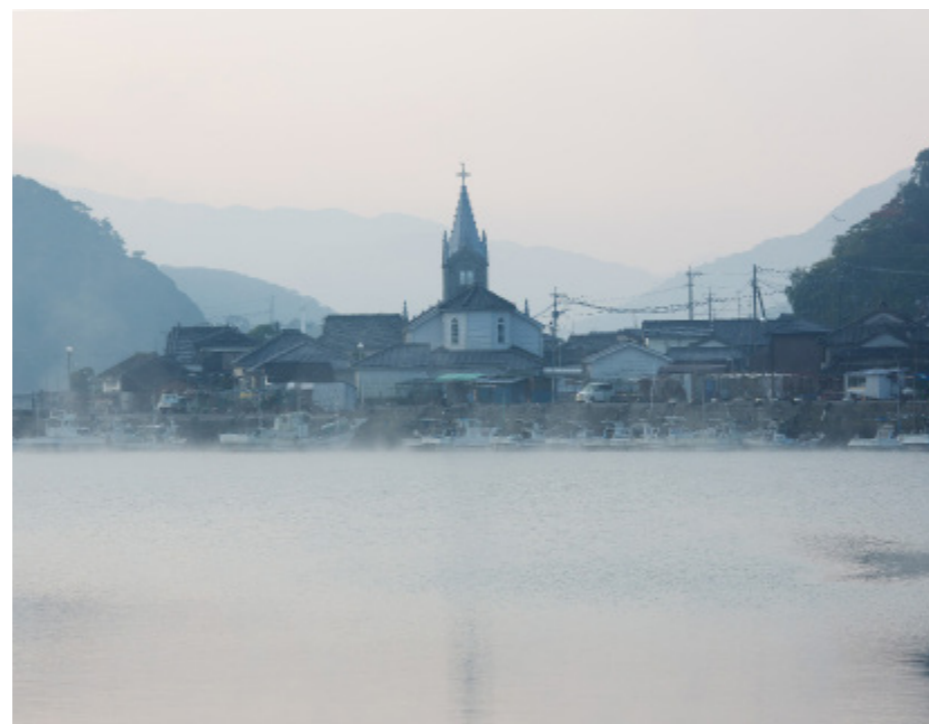
天草「崎津教会」(長崎と天草地方の潜伏キリシタン関連遺産)