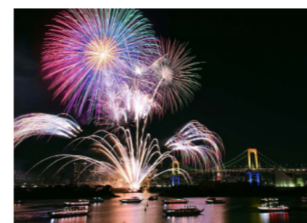
貸切クルーズ船でのオープニングパーティと花火鑑賞